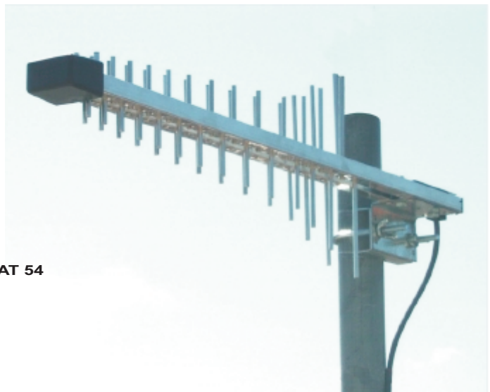
GSM/UMTS-Antenne LAT 54 Art.-Nr.768094